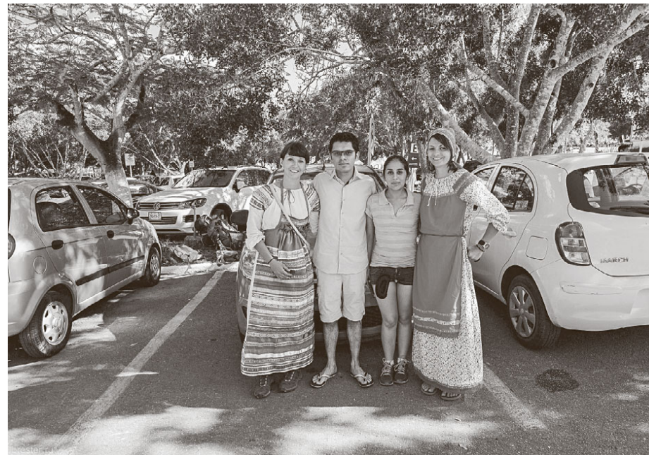
Автостопом в русских народных костюмах по Мексике

— Если и случались, то по собственной вине. Нередко я не беру с собой необходимое. Например, могу отправиться в горы без воды, а потом узнать, что там нет источника. Таких ситуаций было много. В Боливии есть тропа, которая называется Дорога Смерти. Это велосипедный маршрут, он начинается с высоты 3300 метров над уровнем моря, а заканчивается внизу — у подножия гор. Тропа идёт вдоль склонов, очень опасная. Мы с подругой неправильно поняли и пошли по маршруту с обратной стороны — начали с финиша. Без воды стали подниматься вверх. Поняли ошибку на половине пути, но решили не отступать. Воду просили у проезжающих мимо велосипедистов. Конечно, так лучше не делать.