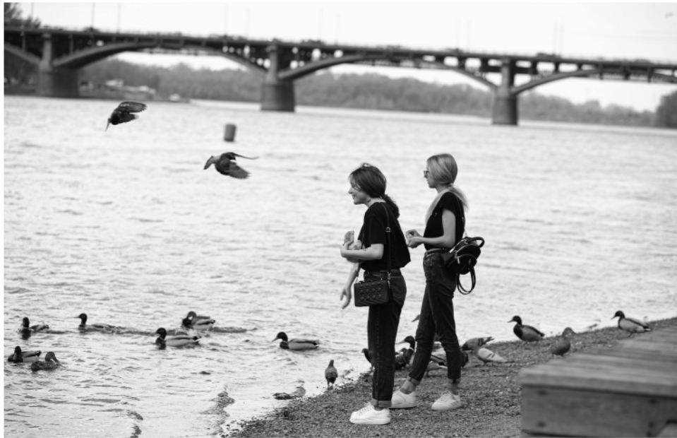
Текст _ Галина ДМИТРИЕВА