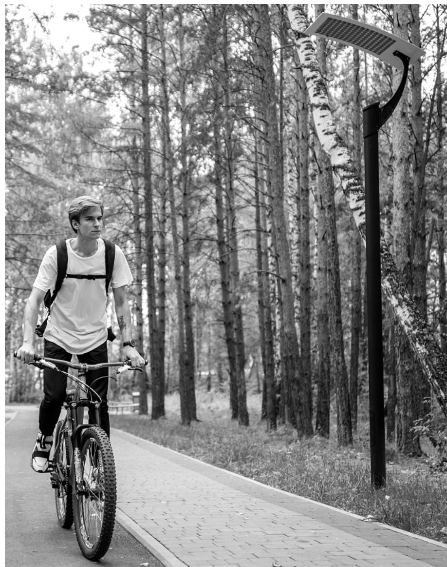
Студенческий бульвар СФУ проходит через лес

— У федеральных университетов, помимо обязанности работать на